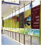
Neue Wandgestaltung am Bahnhof Niederhüchstadt durch die Stadt Eschborn – einladend und informativ.

In der vergangenen Woche wurden am Bahnhof Niederhüchstadt die Oberfläch der Treppenaufgang neu saniert und gestalterische Wandflächen im Zugangsbereich angebracht. Die optischen Aufwertungen geschähen in Auftrag der Stadt Eschborn. Sie folgten auf die Sanierung der Treppentritte und einer Grünwandgestaltung des Bahnhofs durch die Deutsche Bahn.