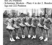
Die FireDevils haben sich damit einen Startplatz auf der Hessenmeisterschaft gesichert. Diese findet am Wochenende, 20./21. April statt.