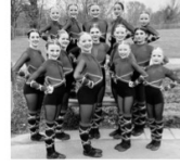
FireStars (Jugendklasse) - Gardetanz Marsch - Platz 2 in der 2. Bundesliga mit 242 Punkten - Schautanz Modern - Platz 4 in der 2. Bundesliga mit 222 Punkten

Letztes Ranglistenturnier der Saison Das letzte Ranglistenturnier der Saison für die FireDevils und FireStars der TGS Eschborn fand am Sonntag, 24. März in Jülich in Nordrhein-Westfalen statt. Hier die Ergebnisse im Überblick: FireDevils (Schülerklasse) - Gardetanz Marsch - Platz 3 in der 1. Bundesliga mit 264 Punkten - Schautanz Modern - Platz 1 in der 2. Bundesliga mit 238 Punkten