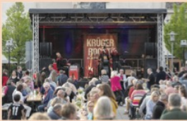
„Krieger Rock“ sorgten für Stimmung.

Gina Gießels beachten einfach alle zum Stanten. Den Sonntagsmittag krönten die Landfrauen mit ihrem leckeren Erdbeerkuchen. Auf der Bühne am Rathausplatz sahen am Vereinsnachmittag viele begeisterte Zuschauerinnen und Zuschauer Tanzvorführungen der Kinder und Jugend der Eschborner Käwwern. Die Eschborner Vereine kümmerten sich in großzügiger Weise um das leibliche Wohl der Gäste. Ob Säfte, Herzhafes oder Delikatess, an den leckeren Verkostungstischen der Vereine wurde jede und jeder fündig.