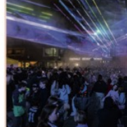
„Rock Diamond“ hielten den Publikum ein