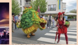
„Rock Diamond“ hielten den Publikum ein