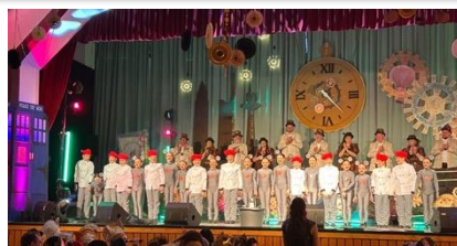
Die Dancing Kids