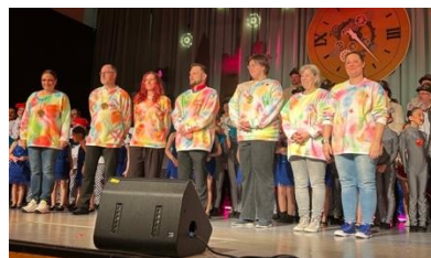
Die Hot Screws, Gestaltungsgruppe