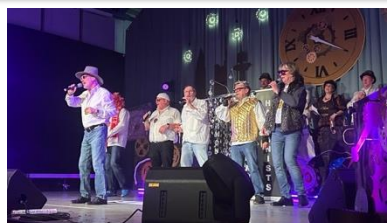
Die Kondominus Harmonists