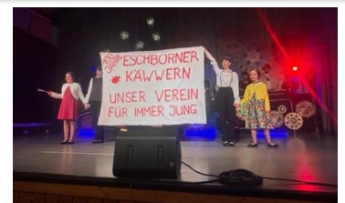
Die Dancing Teens